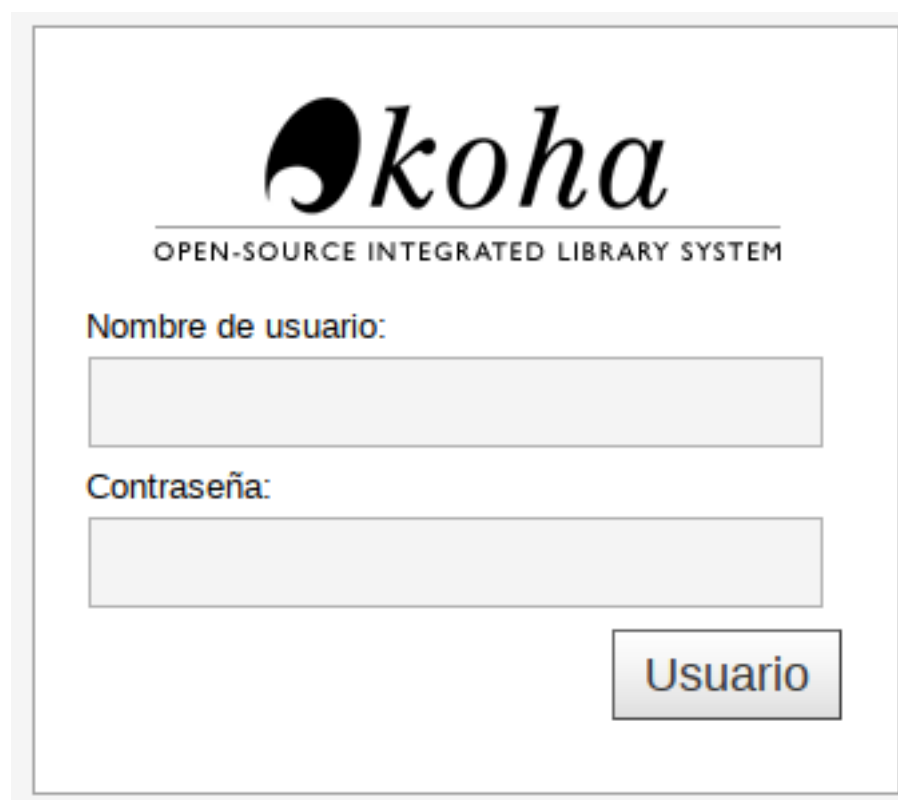
Figura 17: Acceso a la Intranet

La URL de ingreso a la Intranet-Koha es: https://intra.siunpa.unpa.edu.ar:444