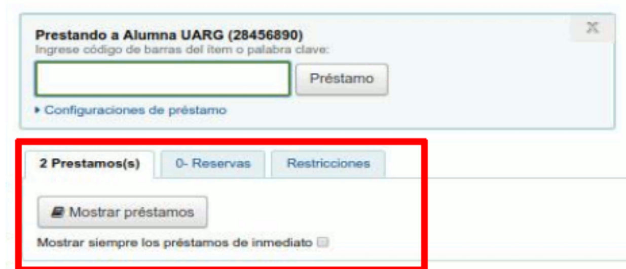
Figura 29: Mostrar préstamos.

Una vez seleccionada la opción " Préstamo in situ " deberá también especificar la fecha de vencimiento, pudiendo colocar una hora de devolución del material. Una vez ingresado el código de barras deberá hacer clic sobre el botón Préstamo de la Figura 28, luego se visualizarán en la sección inferior de la pantalla las opciones para ver los préstamos, Figura 29: