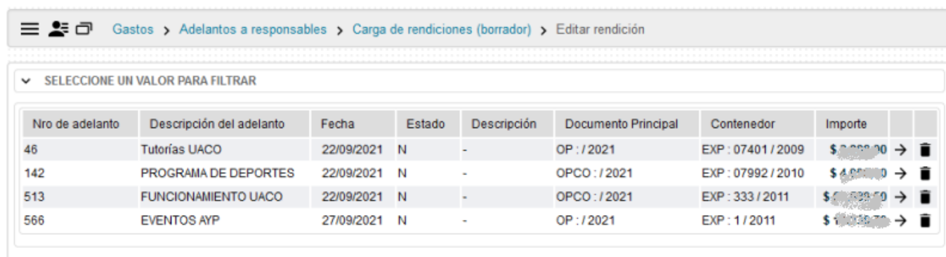
Figura 2.9: Editar rendición borrador.

En la pantalla de la Figura 2.9 se muestra el resultado de haber filtrado todas rendiciones en borrador, también se puede realizar el filtro utilizando algún otro dato más específico como el Nro. de adelanto u otro dato, si así lo desea.